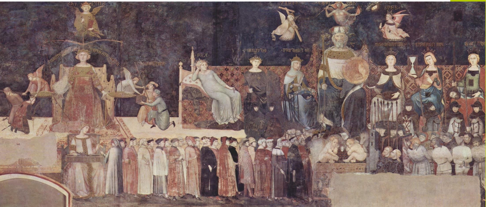
Ambrogio Lorenzetti Allegoria del buon governo

«Amalegiatgiustiziamqchiegovaंतरante(Sap(Sap) 1,1)